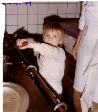
dès le plus jeune âge au fourneau

billard, une salle de jeux, une aire de jeux extérieure pour enfants, un échiquier géant, un parc d'un hectare avec un sentier botanique, un tennis, ; en résumé, tout le confort nécessaire à la réalisation d'un séjour réussi pour ses hôtes